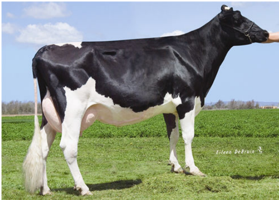
EVER-GREEN-VIEW EAN Granddam